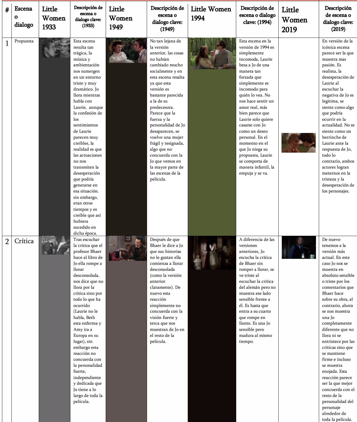
Tabla de comparación